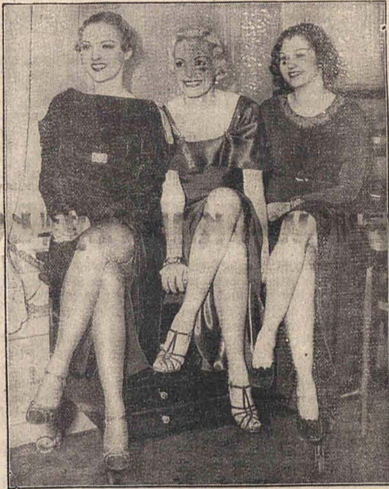
W Nowym Jorku odbędzie się w najbliższych dniach konkurs piękności. Oto trzy pretendenci do pierwszej nagrody.