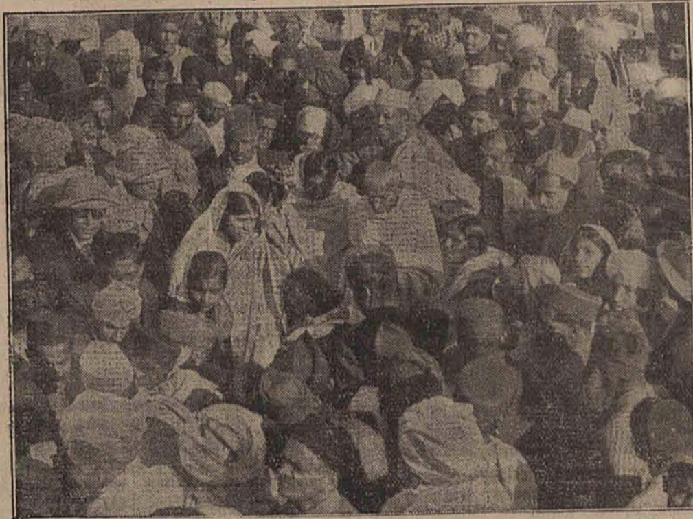
Po dłuższej przerwie rozpoczął znów swą działalność polityczną duchowy przywódca hindusów Mahatma Gandhi, którego widzimy w otoczeniu jego zwolenników w Delphi.