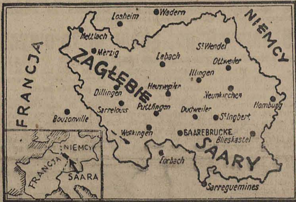
Zagłębie Saary — teren dzisiejszego plebiscytu. Z boku mapka sytuacyjna niemiecko - francuska.

sób obejścia tego zakazu. Wywieszane są same drzewca od chorągwi z przywiezioną na końcu zielenią lub małym wieńcem.