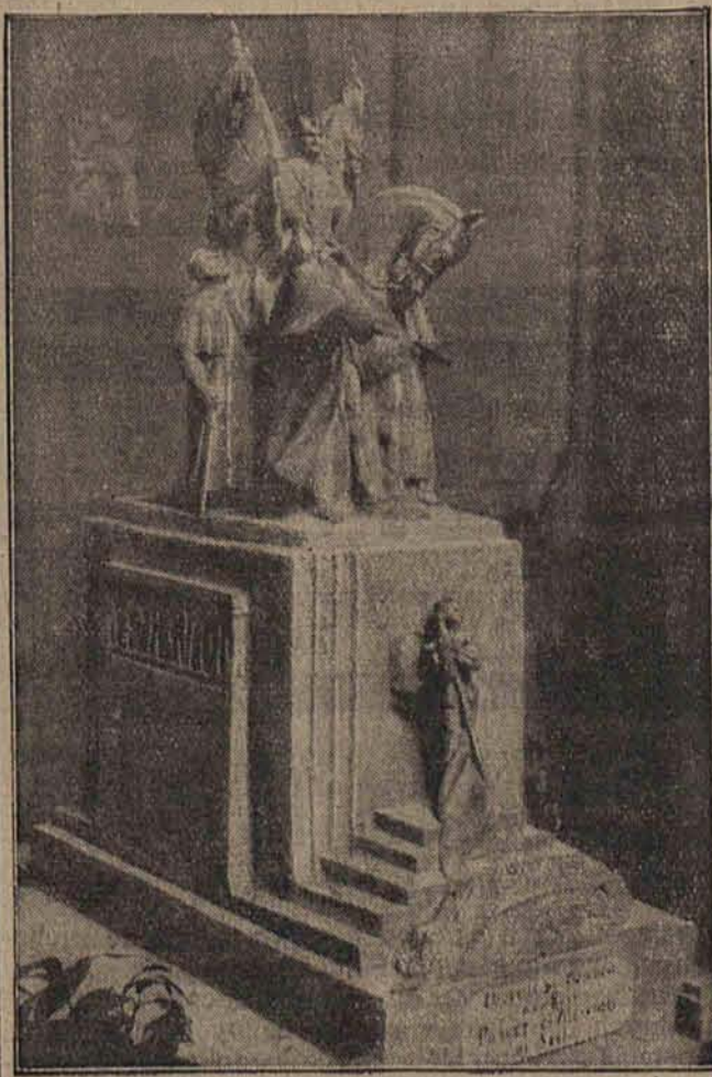
POMNIK PARYŻA DLA KROLA ALEKSANDRA.