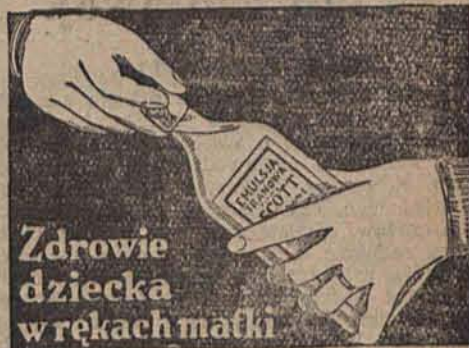
Zdrowie dziecka w rękach matki

W zimie szczególnie organizm dziecka wymaga wzmocnienia i uodpornienia, gdyż w tej porze roku, nawet lekkie przeziębienie spowodować może niebezpieczne dla zdrowia komplikacje. Emulsja Tranowa f. Scotta zawiera obfitujący w witaminy A i D tran leczniczy, oraz hipofosfity wapnia i sodu. Dzięki temu wzmacnia ona wydalinę organizmu dziecka, pobudza apetyt, wzmacnia wzrost i powoduje przybieranie na wadze. Dzieci chętnie przyjmują Emulsję Tranową Scotta, gdyż jest przyjemna w smaku i lekkostrawna. Żądajcie zawsze prawdziwej Emulsji Tranowej wyrobu firmy