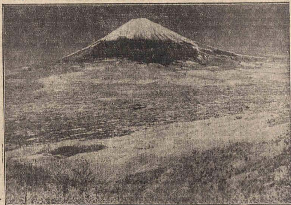
Z polecenia Instytutu Naukowego w Tokjo, dokonano z odległości 250 kilometrów zdjęcia najwyższej góry japońskiej, Fujiyama, przy pomocy infra-czerwonych promieni. — Zdjęcie przedstawia masyw górski, którego zwykłe oko ludzkie nie byłoby zdolne objąć.