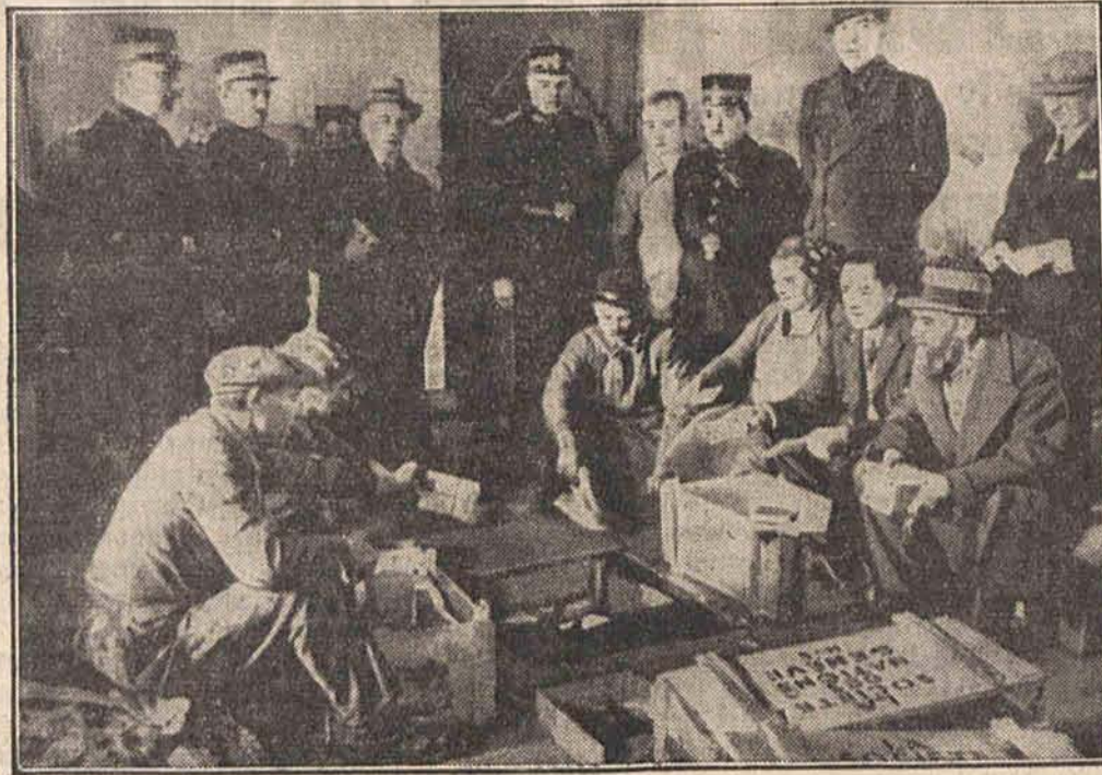
Wszystkie kartki plebiscytowe z Zagłębia Saary zostały przewiezione do Genewy, gdzie spalono je pod eskortą policji.