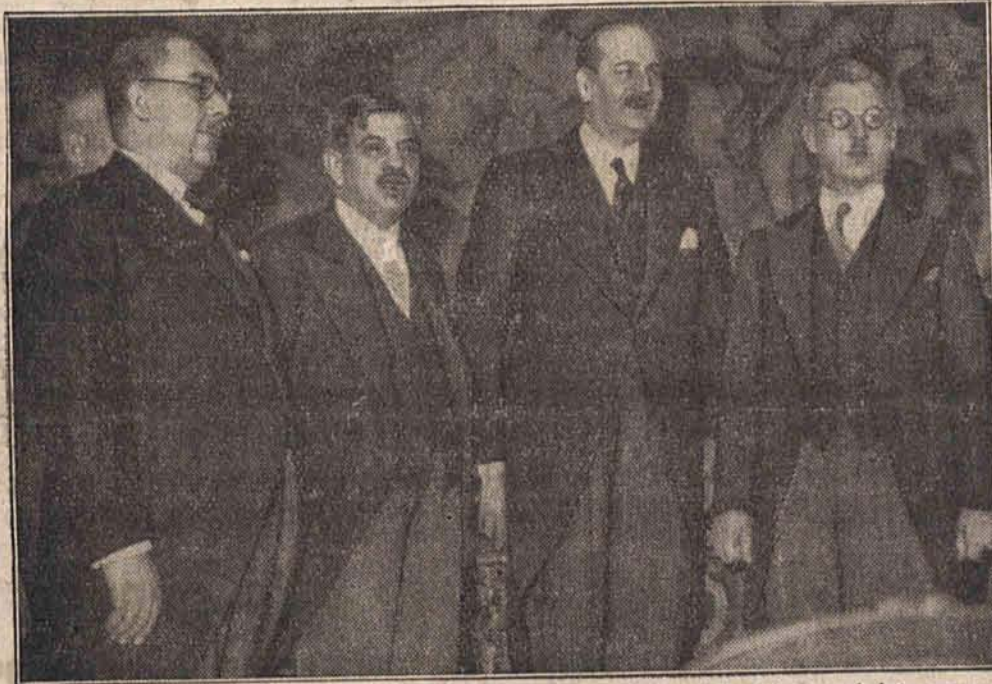
Kanclerz austriacki dr. Schuschnigg w towarzystwie austriackiego ministra spraw zagranicznych Berger-Waldenegga, ministra Lavalla i premiera francuskiego Flandina.