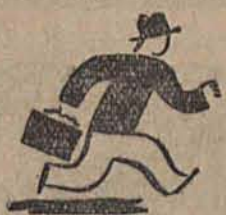
Informacje i zapisy:

GDYNIA - AMERYKA - LINJE ŻEGLUGOWE S.A. WARSAWA, PLAC MAŁACHOWSKIEGO 4 oraz BIURA PODRÓŻY.