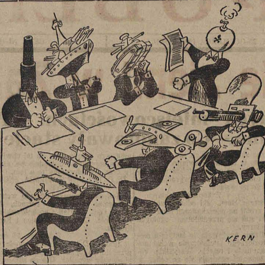
Zdemaskowani uczestnicy przyszłej konferencji rozbrojeniowej.

(Pat) Niemieckie biuro informacyjne donosi: W związku z wizytą ambasadora polskiego w Berlinie u ministra spraw zagranicznych Rzeszy, pojawiło się w prasie zagranicznej doniesienie o proteście rządu polskiego przeciwko ustawie niemieckiej z dnia 16 marca. Czynniki kompetentne wyjaśniają, że to doniesienie jest całkowicie nieścisłe.