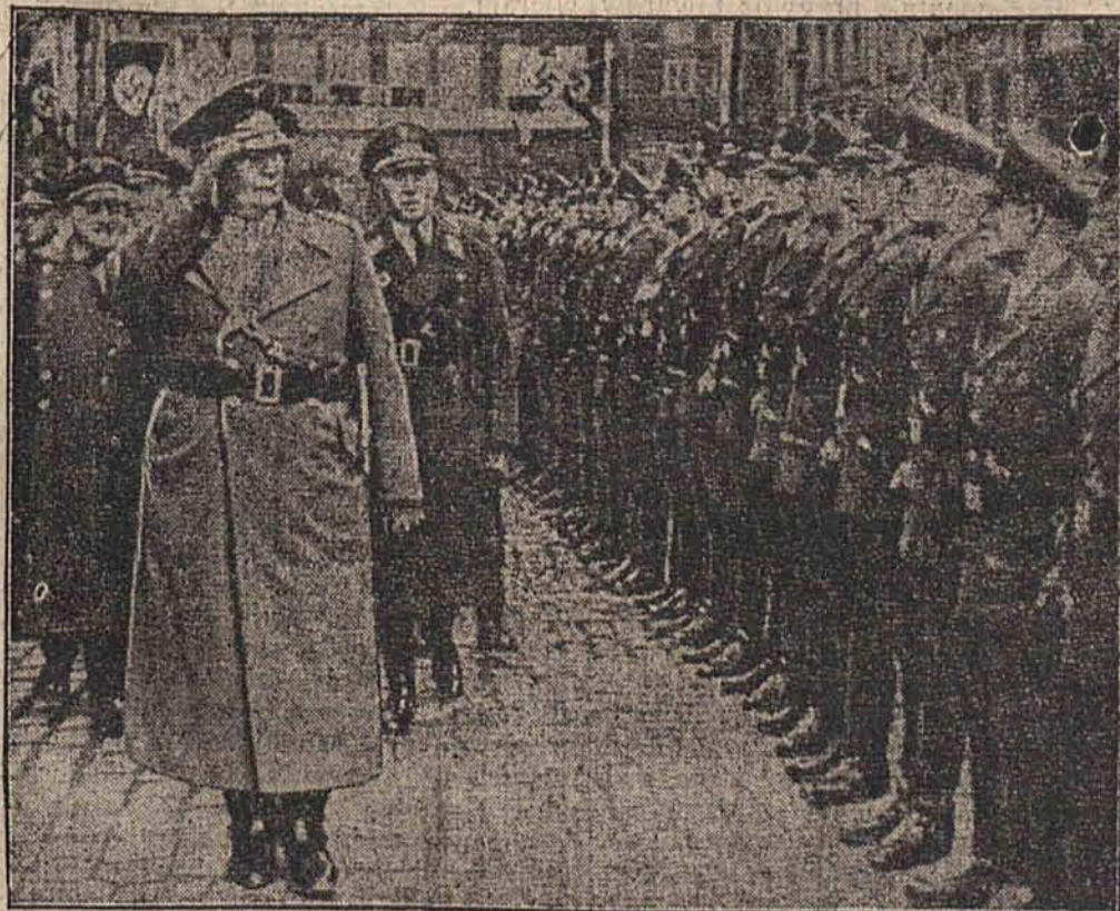
Gen. Goering bawił w Gdańsku, gdzie wygłosił przemówienie w związku z odbywającymi się wyborami do sejmu gdańskiego. Na zdjęciu widzimy Goeringa w Gdańsku przed frontem kompanji honorowej.