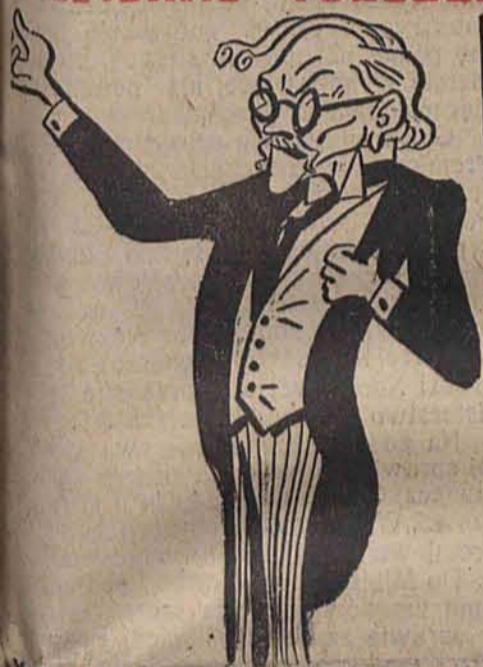
Donald, premier Anglii, w karykaturze.

skich w Stresie wydany przez Mussoliniego dla członków konferencji.