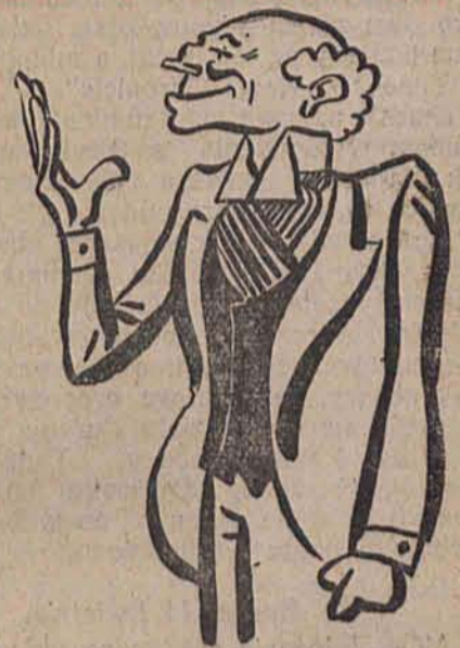
Sir John Simon w karykaturze.

Głosy, które pojawiły się zagranicą, krytykujące rząd brytyjski za to, że nie złożył żadnej stanowczej deklaracji o polityce wobec Niemiec nie przeszły niezauważone w Londynie. Agencja Reutersa sądzi, że zaniepokojenie, panujące na kontynencie jest całkowicie uzasadnione i Wielka Brytania w pewnej mierze podziela je. W każdym razie prze-