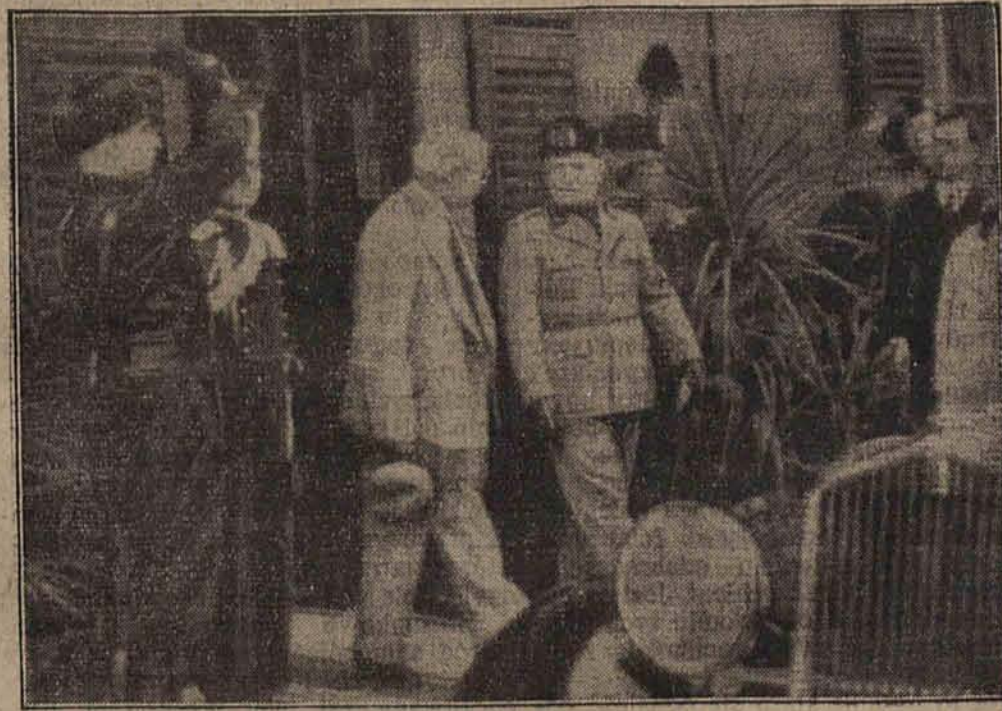
Na zdjęciu widzimy Mussoliniego i premiera angielskiego Mac Donalda, udających się razem na konferencje do pałacu Boromeusza na Isola Bella.

wiozą ze sobą medal wojskowy za udział w wojnie, który złożyli na grobie Nieznanego Żołnierza włoskiego, a oprócz tego pamiątki z czasów wojny i arcydzieła sztuki dla króla Włoch i Mussoliniego.