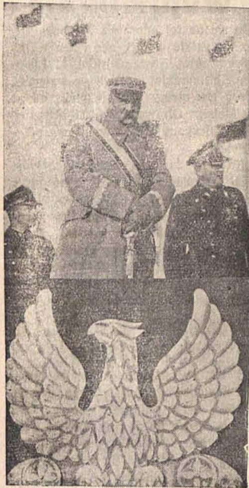
Odszedł od nas, a jednak żyje!

Wieści żałobne głoszą, iż umarł, a jednak trudno temu uwierzyć!