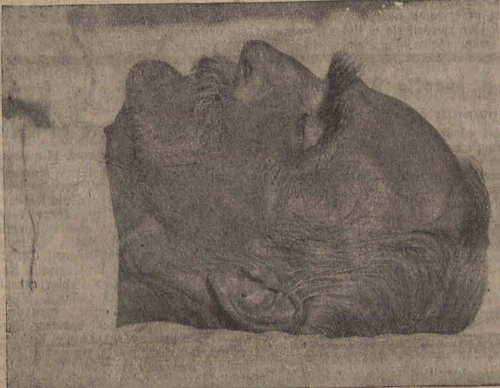
Marszałek Piłsudski na łożu śmierci

Po przybyciu konduktu pogrzebowego na Wawel zwłoki zostaną złożone w Katedrze, gdzie będą spoczywały do godz. 10 wieczorem.