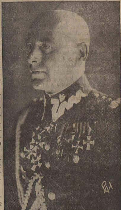
Nowomianowany gen. insp. sił zbrojnych gen. Edward Rydz-Śmigły.

Równocześnie odbyły się nabożeństwa w kościele ewangelickim, w synagodze postępowej, gdzie zebrały się poczty sztandarowe organizacji żydowskich, wreszcie w starej synagodze.