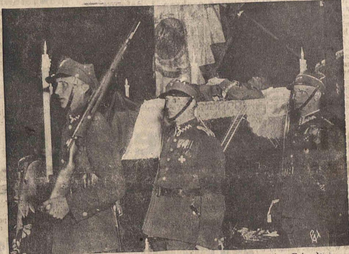
Przy trumnie P. Marszałka, ustawionej w wielkim salonie w pałacu Belweder skim dzień i noc pełnili straż żołnierze, podoficerowie i oficerowie armii.

O godz. 19.55, zatrzymuje się przed portami, prowadzącymi na dziedzińcu belwederski, samochód Pana Prezyden-