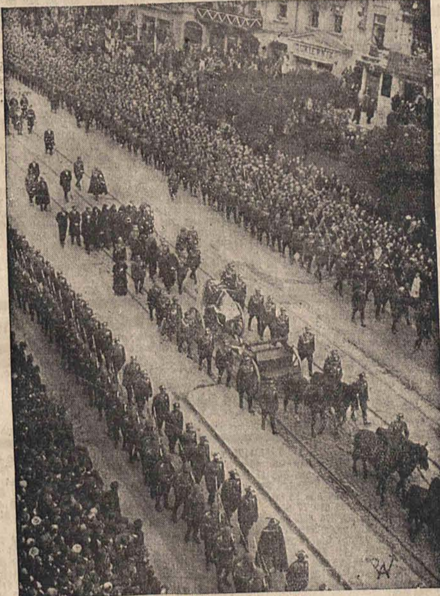
Kondukt żałobny na ulicach Warszawy.

Dzisiaj w nocy dyżurują następujące apteki: Potasza (Plac Kościelny 10), A. Charemzy (Pomorska 12), E. Millera (Piotrkowska 46), M. Epsteinajna (Piotrkowska 225), Z. Gorczyckiego (Przejazd 59), G. Antoniewicza (Pabjanicka 50)