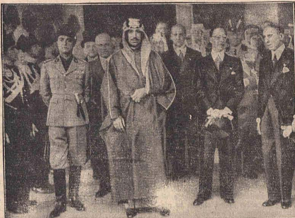
Władca Hedżasu, emir Saud przybył do Rzymu, gdzie przyjęty został przez króla Emanuela. Na zdjęciu widzimy emira Sauda w towarzystwie gubernatora Rzymu i podsekret. stanu Suvicha.

Wystawa jest Mekką malarzy z całego świata. Takiej drugiej chyba już nigdy nie będzie — jak nigdy nie było.