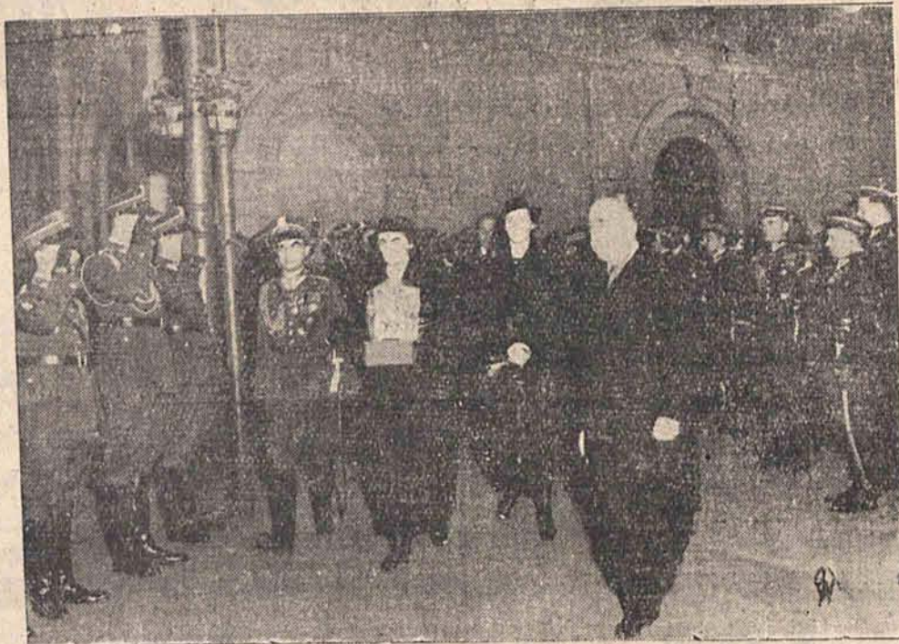
Na dworcu w Warszawie. Pani Marszałkowa Piłsudska niosąca urnę z sercem do specjalnego wagonu, w którym przewieziona została do Wilna.

Na przodzie postępuje ze sztandarem polska korporacja akademicka „Lauda”