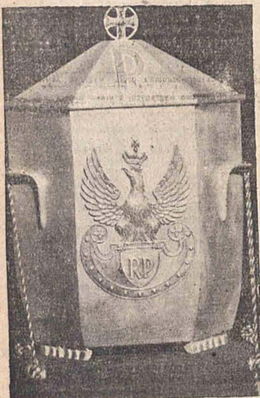
Urna srebrna, w której złożono serce Marszałka Piłsudskiego.

Trumnę złożono w dolnym kościele św. Teresy, gdzie ks. biskup Michałowicz odprawił modły żałobne. O godzinie 19.15 uroczystości żałobne zakończyły się.