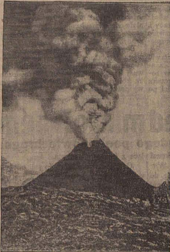
WEZUWJUSZ GNIEWA SIĘ..

Reprezentacjom skautów zagranicznych, które ze wszystkich państw europejskich w łącznej liczbie ponad dwa i pół tysiąca druhów przyjadą do Spaly, i polskiej młodzieży z zagranicy — będzie się czem pochwalić.