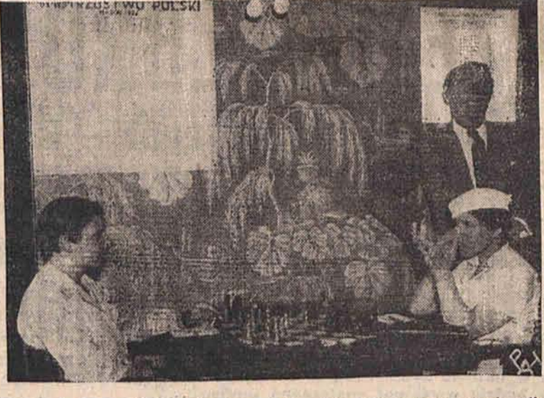
Puderniczka jest najniezbędniejszym przedmiotem w ekwipunku kobiety w każdej okoliczności życia. Jak widzimy na załączonych zdjęciach, puder uspakaja nerwy przed startem na awionetce turystycznej, a nawet pomaga myśleć przy szachach.

Zaburzenia żołądka i jelit. Specjaliści chorób żołądka oświadczają, że naturalną wodę gorzką „Franciszka Józefa” można gorąco polecić jako bardzo skuteczny środek domowy.