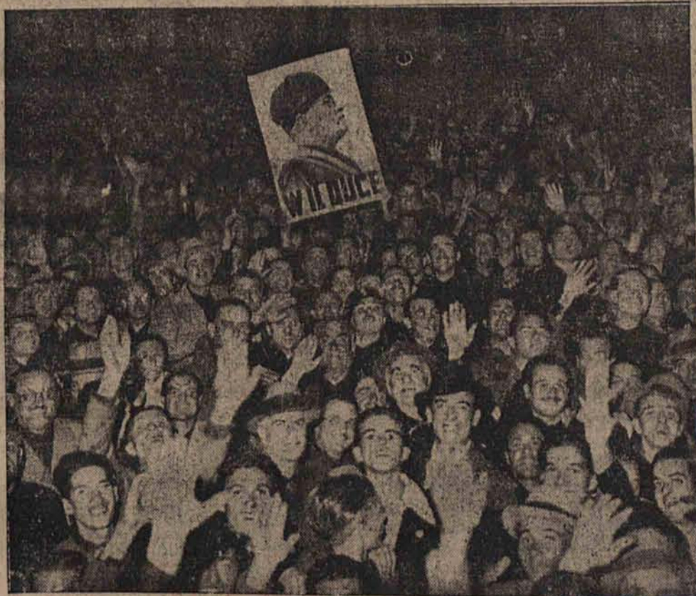
W środę odbyła się w Italii generalna mobilizacja faszystów, do których przemówił Mussolini. Na zdjęciu widzimy tłumy faszystów, wzywających przed Pałacem Wenezya w Rzymie.

ze zdwojonym rozmachem i entuzjazmem posuwały się naprzód. Pierwszy korpus włoski oraz korpus, złożony z wojsk tubylczych osiągnęły oddziałami przednimi Addigat i Entiscio, gdzie ludność wywiesiwszy białe chorągwie, oddała się pod opiekę Włoch.