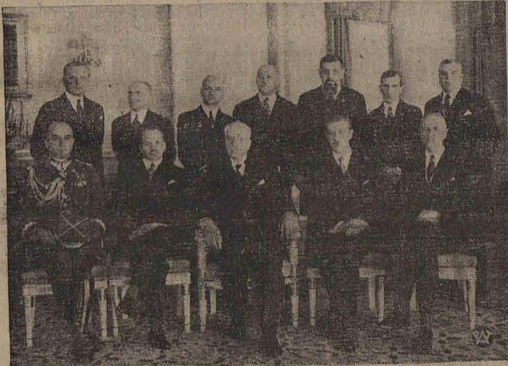
Na zdjęciu nowy rząd u Pana Prezydenta po złożeniu przysięgi.

Rząd jest świadomy swojej wielkiej odpowiedzialności i swych zadań, które nakłada ciężka sytuacja gospodarcza, ale o wartości narodu decyduje wytrwałość i spokój w przewidywaniu trudności przez samo społeczeństwo. Jeżeli te cechy i wartości znajda szeroki odzwiek w społeczeństwie, to nie tylko zostanie ułatwione należyte wwiązanie się rządu z ciężką na nim odpowiedzialnością, ale równocześnie zostanie dany realny wyraz, że zrozumielni i prawdziwie i odczuliśmy głęboko te wskazania, które w Polsce pozostawił na przyszłość Jej niezamierzony wódz, Marszałek Józef Piłsudski.