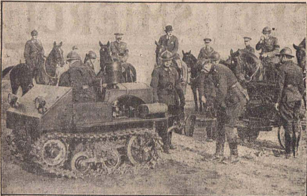
W armji belgijskiej wprowadzono traktory, które zastąpią konie w oddziałach artyleryjskich.