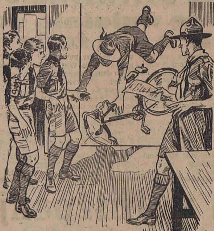
...drzwi otworzyły się z trzaskiem i do izby wleciał głową naprzód Karol...

Wszyscy już byli, oprócz Karola. Czekano jeszcze kwadrans. W końcu drużynowy rzekł: