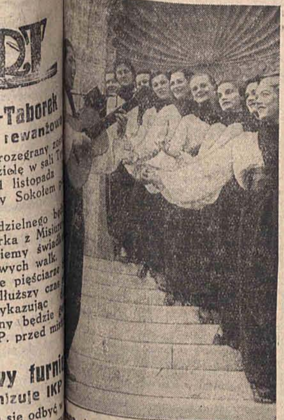
Trupa rewelersów kobiecych z artysty, przybyła na gościnne występy do Europy, zamierzając odwiedzić stolice wszystkich państw.