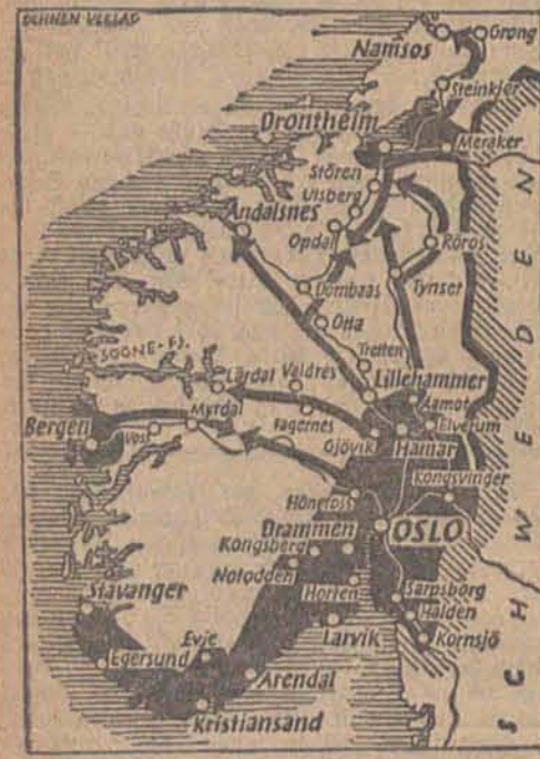
Deutscher Vormarsch seit 22. 4. 1940

Berfolgen wir an Hand der Karten rückpunktartig das Fortschreiten der deutschen Truppen aus dem Raum von Oslo heraus mit Bezug auf die Mitteilungen der Wehrmachtsberichte: Hamar und Elverum sind am 10. April erreicht und bilden Ausgangspunkte für das Vordringen