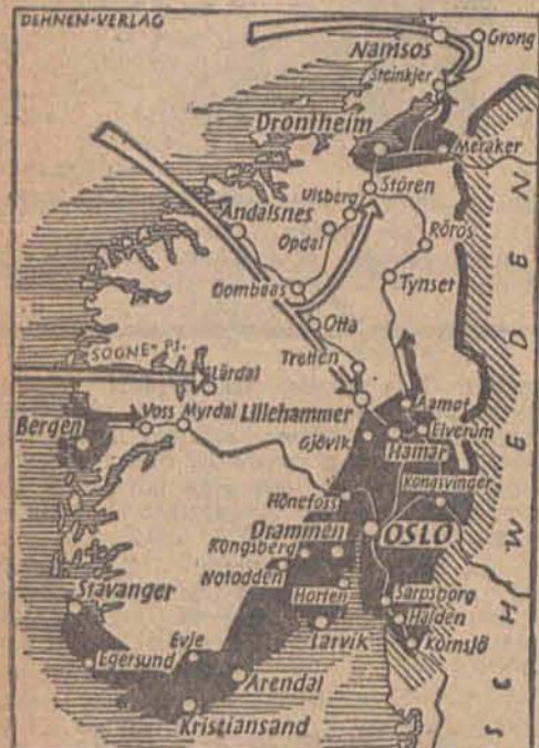
bis zum 21. 4. 1940 von deutschen Truppen, Engländer Operationsplan.

Wir haben es unternommen, in zwei Kartenskizzen den Verlauf der deutschen und der feindlichen Operationen im Raum Süd- und Mittelnorwegens zur Darstellung zu bringen, soweit sie durch unsere D.R.M.-Berichte und die ergänzenden Nachrichten in ihrem Gefüge erkennbar geworden sind. Der britische Plan ging in der Hauptsache darauf aus, Drontheim von Norden und Süden in die Zange zu nehmen und die deutschen Truppen zu werfen. Unsere Skizze läßt die britischen Bewegungen, wie sie geplant und zum Teil zur Durchführung kamen, erkennen. Neben dem Versuch, Drontheim zu nehmen, wurde ein zweiter unternommen, in den Raum von Oslo vorzustoßen. Bei Lillehammer aber begann bereits der Rückzug vor der deutschen Entschlossenheit, der in regellose Flucht über Dombaas auf die Transportschiffe von