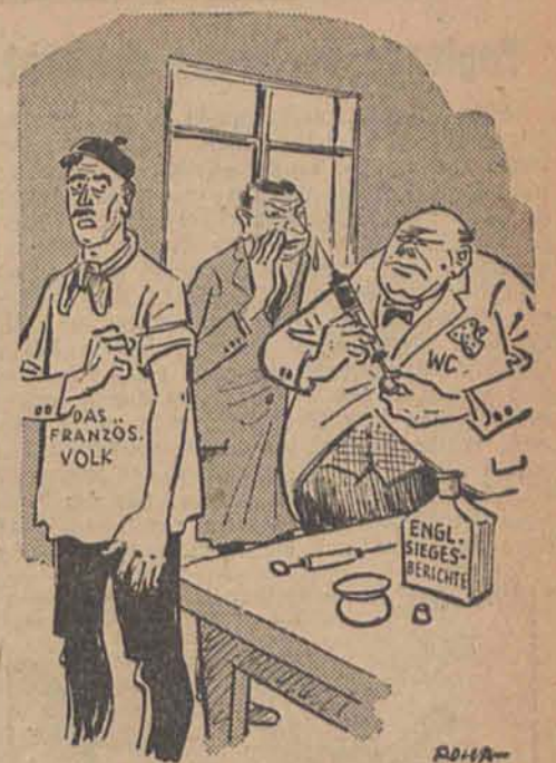
Die tägliche Nervenspritze Reynaud zu WC.: „Den Franzosen müssen wir schon eine ebenso starke Dosis geben wie Deinen Engländern!“

Aber nicht mehr glücklich. Seine Nächte sind durchweht mit Seufzern nach der früheren Ein-