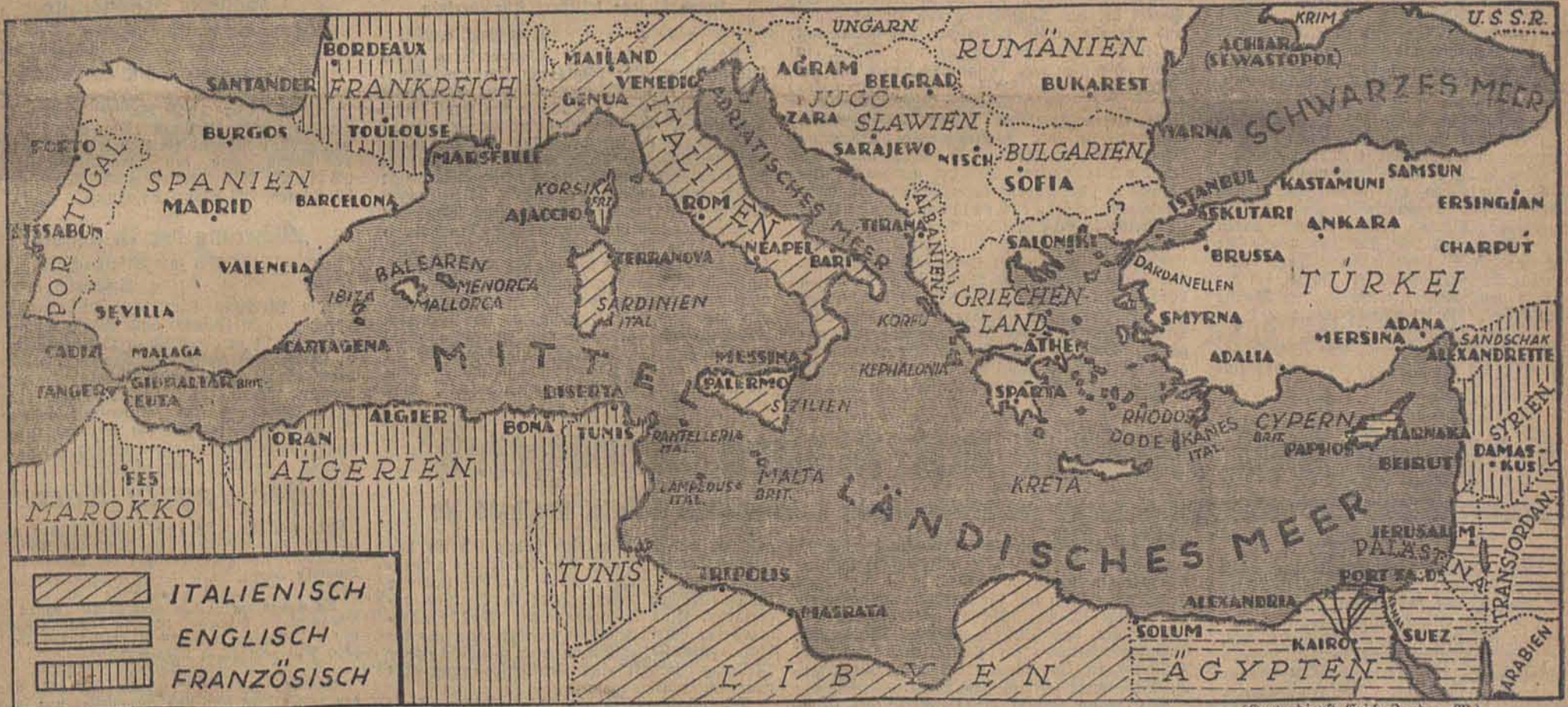
(Kartendienst Erich Jander, M.)

dränge. Die Antwort auf alle diese Druckversuche hat die italienische Presse seit langem laufend gegeben. In welcher Richtung aber auch sonst die westlichen Blütokraten in diesen Tagen lauschen mögen, sie werden in Fülle Stimmen hören, aus denen sie entnehmen können, daß die von ihnen jetzt bedrohten Völker auf der Hut sind, und daß der Versuch einer Durchführung des für den 20. Mai gegebenen Auftrags von vornherein in sich den Keim tragen wird, daselbe Schicksal zu erleiden wie das Norwegen-Abenteuer. Gespannte Aufmerksamkeit Moskau beobachtet die Lage im Mittelmeer Moskau, 8. Mai Im außenpolitischen Teil der „Pravda“, die am Dienstag als einziges Blatt erscheint, stehen die Nachrichten aus Norwegen weiter im Mittelpunkt. Besondere Beachtung rufen die Meldungen über die neuen Erfolge der deutschen Luftwaffe im Kampf gegen die britischen Flotteneinheiten hervor. Die Lage wird hier mit gespannter Aufmerksamkeit beobachtet.