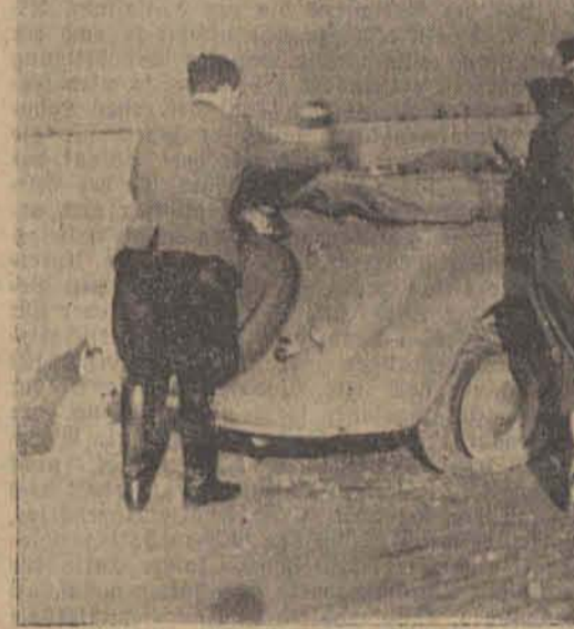
Eine Reisepanne wird sofort behoben

„Hier, dieses Fahrzeug ist ungenügend getarnt!“ Dann folgten einige Übungen des Fliegeralarms und der Deckung im Gelände.