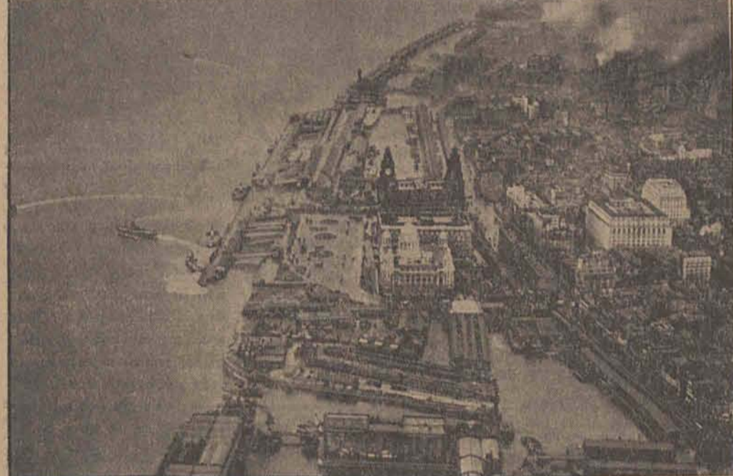
Neue schwere Angriffe auf Liverpool In den vergangenen Nächten lag Liverpool erneut unter den schweren konzentrischen Schlägen unserer Kampfgeschwader. Die Korrespondenten berichten zuletzt von einer „wahren Schredensnacht“, die Liverpool hinter sich habe.

fragt auch nicht lange... wie aus dem Nichts steht er vor seinem Brotherrn. Rothschild ist im Zimmer auf und ab gegangen. Er denkt angestrengt nach, überfliehet eine Weile lang den wartenden Bronstein.