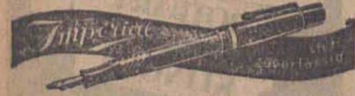
Imperial-Füllhalterfabrik Gerlach und Wegner Hauptverwaltung: Leipzig C-1

gebraucht man die seit über 10 Jahren ärztlich erprobt und bewährte Cepio-Linur, die in allen Apotheken und Drogerien in Flaschen zu fünfzig bis hundert Gramm und in Pulverform zu neunhundert Gramm erhältlich ist. Sie desinfiziert wie Jodo-Linur und wird genau so angewandt. Cepio-Linur findet nicht nur bei Hieb-, Stich-, Biss-, Schnitt- und Schusswunden Anwendung, sondern auch bei Entzündungen in der Mundhöhle und bei Zahnfleischentzündungen sowie zur Desinfektion von Wunden und Injektionsstellen. Infolge ihrer großen Tiefenwirkung erreicht sie sich ferner bei Wundlungen, Quetschungen und in allen Fällen, in denen eine gesteigerte Durchblutung des Gewebes erwünscht ist, als sehr brauchbares Behandlungsmittel.