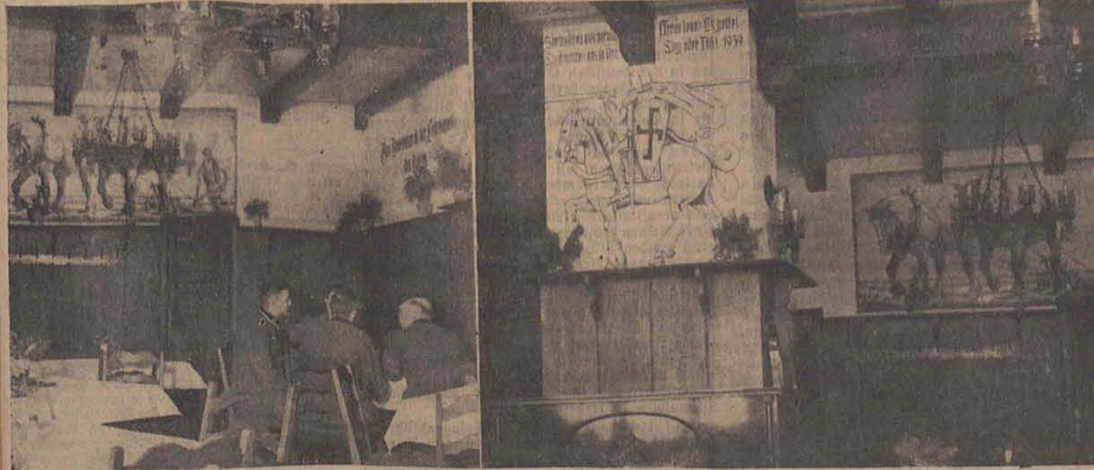
Das Innere der deutschen Gaststätte in Wienstadt. Saftigkeit, vereint mit künstlerischem Geschmack (Zu unserem Aufsatz auf Seite 7 „Gaststättenkultur im deutschen Osten“).

NS-Kriegsopferversorgung e. V. Am heutigen Mittwoch um 19 Uhr findet in der Geschäftsstelle, Hort-Bessel-Straße 18 II, eine Besprechung der Kameradschaftsführer statt. Abrechnung für das Jahr 1940! Erscheinen der Kameradschaftsführer oder Vertreter von jeder Ortsgruppe erforderlich.