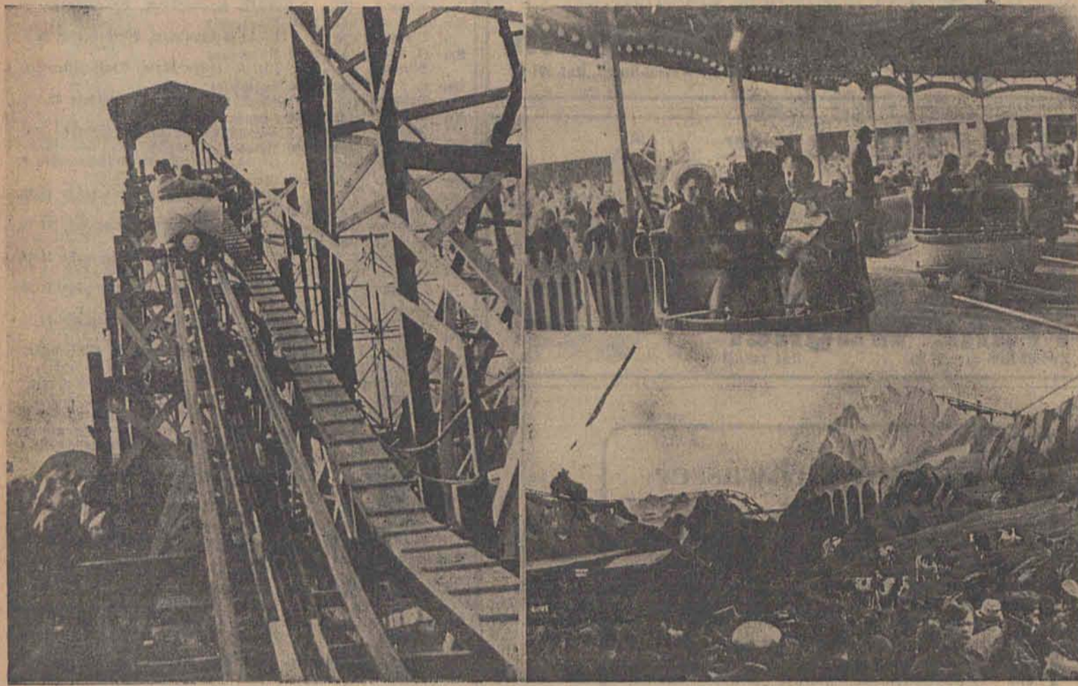
Luftig geht es bei den Fahrgeschäften im Lunapark auf dem Blücherplatz zu. Unser Bild links und unten rechts zeigt die Alpenbahn, rechts oben „Die Peitsche“

Jung und alt verleben frohe Stunden bei den Schaustellern im reisenden Lunapark in Litzmannstadt