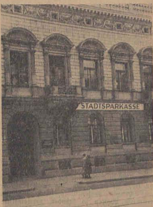
In der Adolf-Hitler-Straße 77 wurde die Städtische Sparkasse eröffnet.