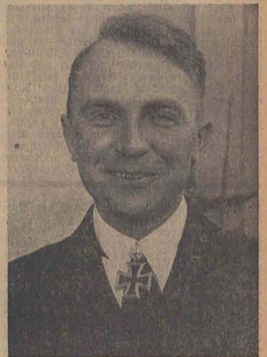
Wie der gestrige DNR-Bericht meldet, ist Korvettenkapitän Günther Prien von seiner letzten Feindschiffahrt nicht zurückgekehrt.