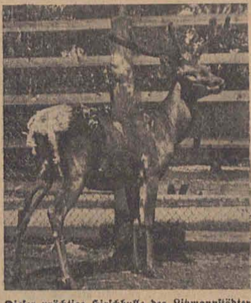
Dieser prächtige Hirschkühe des Litzmannstädter... Dieser prächtige Hirschkühe des Litzmannstädter...