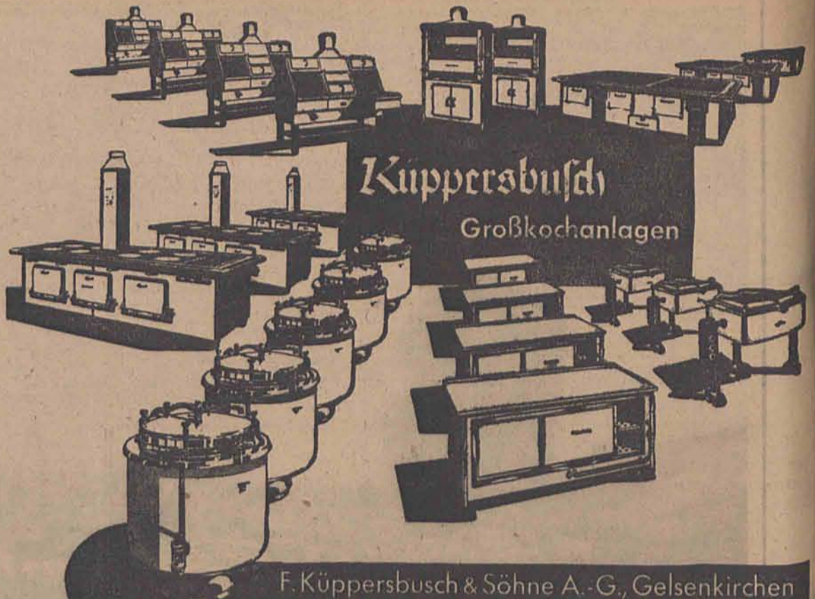
F. Küppersbusch & Söhne A.-G., Gelsenkirchen

Mannschaftsbetten und Schränke Mannschaftsbaracken sämtl. Barackenmöbel sofort lieferbar M. NIEMIERSKI Hamburg-Harburg Gr. Schippsee 19/21