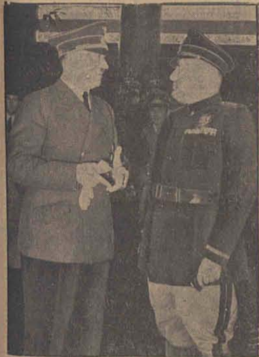
Der Führer und der Duce trafen sich am Brenner zu einer mehrstündigen Unterredung über die politische Lage, an der auch der Reichsaußenminister von Ribbentrop und der italienische Außenminister Graf Ciano teilnahmen. Die Aussprache war getragen von dem Geiste herzlicher Freundschaft und ergab die völlige Übereinstimmung der Auffassung der Regierungschefs der beiden verbündeten Länder.

Briten bekommen die Änderung im Ostmittelmeer zu spüren / Böse Vorzeichen für die Verteidigung des ägyptischen Kriegshafens