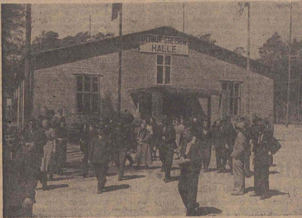
Vor der Arthur-Greiser-Halle