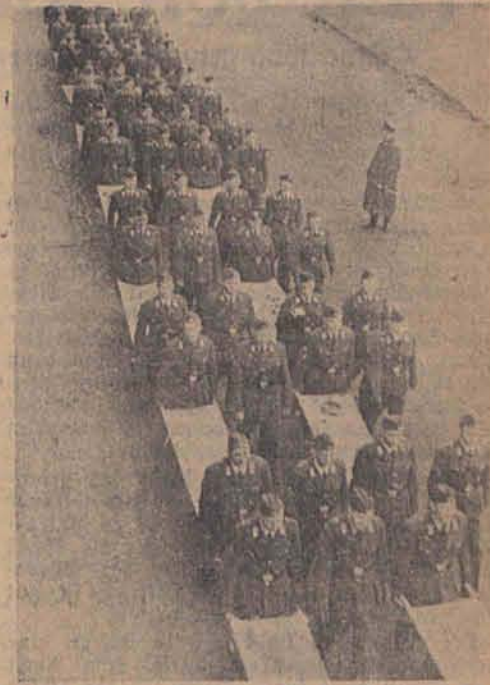
DKA-Helfer in Litzmannstadt mit Tragen auf dem Wege zur Übung

auf die Dorfstraße von Kontrowers, die man nach links verfolgt bis zum gegenüberliegenden Waldrande. In diesem Waldrande geht man nach rechts entlang und erreicht nach wenigen Schritten den Bahndamm der Eisenbahn Zgierz-Kuwo. Vom Bahndamm aus hat man einen schönen Rückblick auf den Forst Lucmierz. Nach Überquerung der Bahn geht man am Waldrande wenige Schritte nach Süd-Osten bis halb links ein Fußweg in den Wald hinein führt. Diesem folgt man bis zu einer quer durch den Wald führenden langen Schneise. Auf der Schneise wendet man sich eine Strecke nach rechts, bis wieder nach links ein Fußweg aus der Schneise abzweigt. Auf diesem Fußwege gelangt man durch sehr schönen Hoch- und Mischwald nach etwa einem Kilometer an den Waldrand. Am Rande geht man ein kurzes Stück nach rechts und verfolgt dann einen Fußweg, der in östlicher Richtung auf Zgierz zu führt. Der Fußweg erreicht nach etwa 1 1/2 km den Friedhof von Zgierz und führt nördlich an ihm entlang in eine Straße hinein, der man nach rechts folgt.