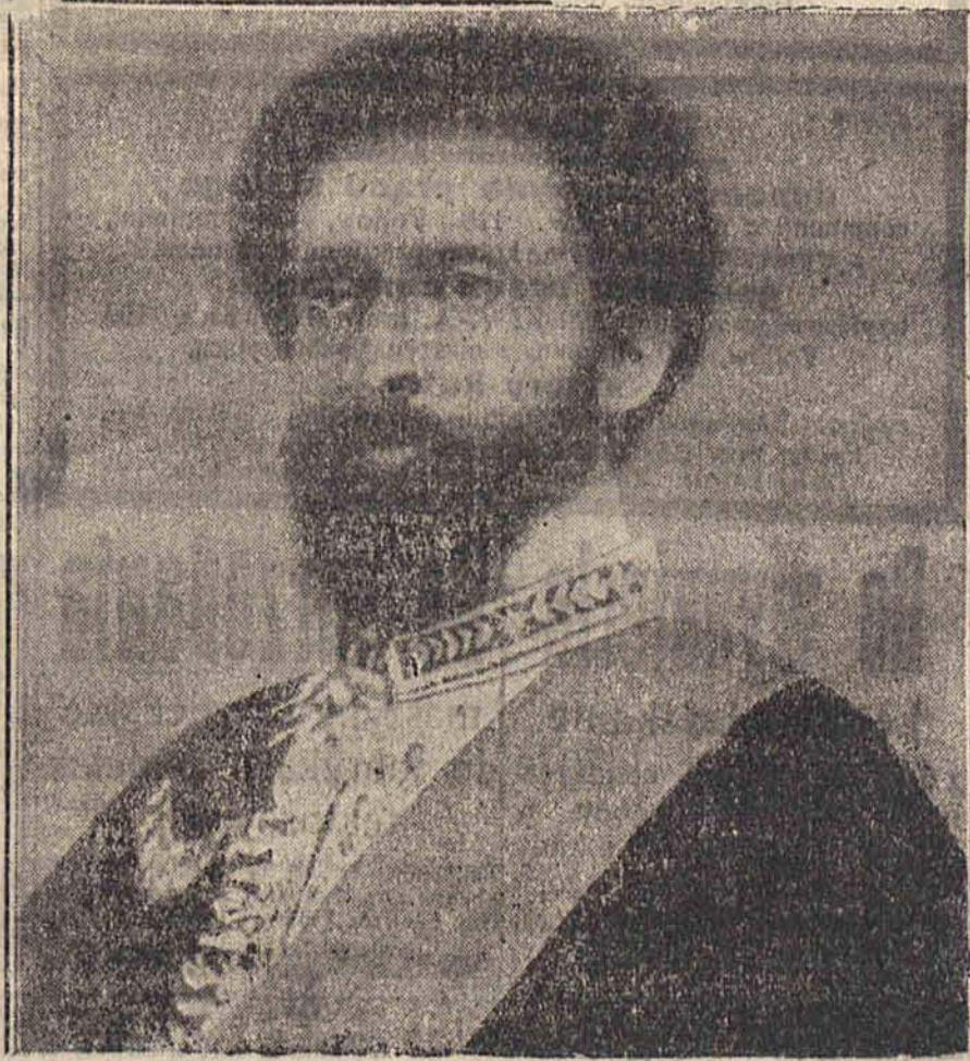
Ras Tafari, król Etiopii przyjeżdża do Europy i odwiedzi Londyn, Paryż i Rzym.

Puls 0,70 — 0,65 Spiess 1,45 — 1,55 — 1,45 Strem 28,50 Welt 0,30 — 0,35 Zgierz 4,10 — 4,15 El. Dabr. 2,60 — 2,50 — 2,70 P. T. E. 0,25 — 0,30 Isla 0,80 — 0,65 Chodorów 6 i pół — 6,20 Czersk 1,30 — 1,20 Częstocice 3,50 — 3,25 — 3,45 Goślawice 2,00 — 2,15 — 2,10 Michałów 0,90 — 1,10 — 0,95