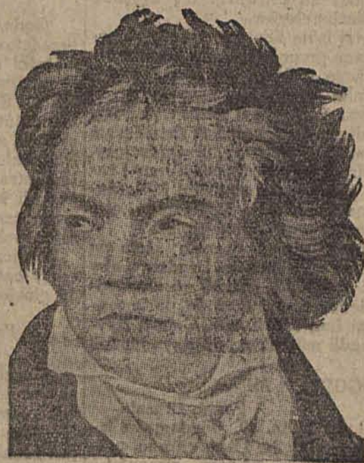
Beethoven w 20 roku życia.