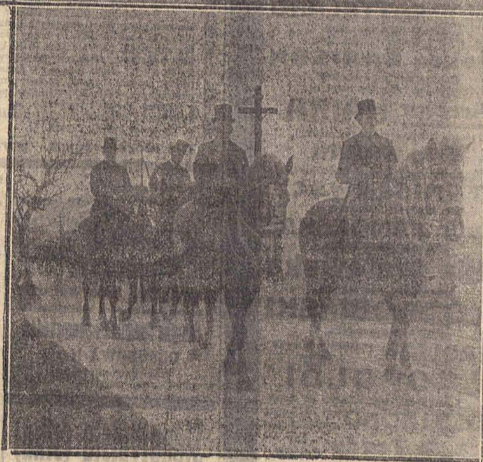
Powyżej. Oryginalne zwyczaje włoskie w święto Wniebowstąpienia: w dniu dzisiejszym we wsiach włoskich odbywają się uroczyste procesje religijne na... koniach i osiołkach.