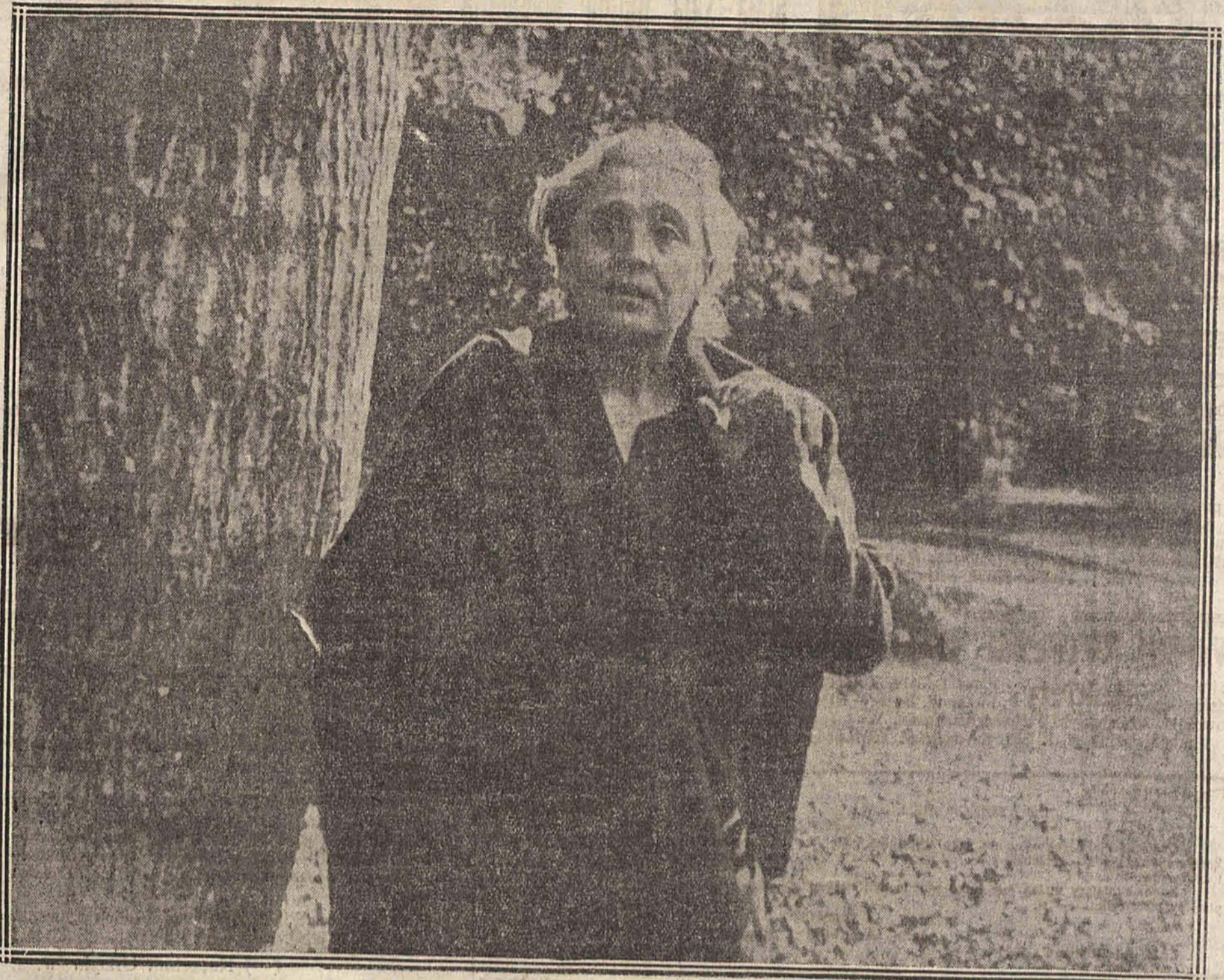
Ślawna aktorka Eleonora Duse, niedawno zmarła w Ameryce, już po śmierci swej ukaże się na ekranie w obrazie „Wieczera“ wytwórni „Paramount Pictures“. Zdjęcie powyższe przedstawia powiększenie z małego negatywu celulooidowego.