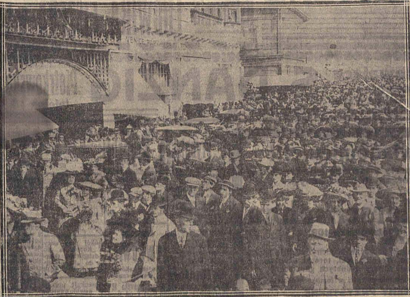
W Stanach Zjednoczonych odbył się zjazd miliardów. Reprezentowanych było 30 miliardów dolarów. Zjazd odbył się pod ochroną 1000 policjantów.