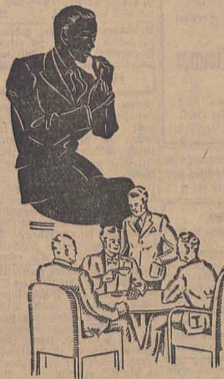
»BALLERINA« 2 1/2, »OSTA« 3 1/2 Das so praktische Hohlmundstück, und der verwandete edle Orienttabak machen beide Zigaretten zu einer stets gern gewählten Qualitätsmarke — die auch der kritischste Raucher zu schätzen weiß.

Die Städtischen Bühnen Litzmannstadt suchen per sofort 2 Malergehilfen (Dekorationsmaler) 1 Herrenschneider Meldungen sind zu richten an die Verwaltung der Städtischen Bühnen Litzmannstadt, Moltkestraße 232 I, Ruf 101-16