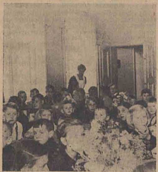
Ein schmackhaftes Frühstück wird den Kindern gereicht