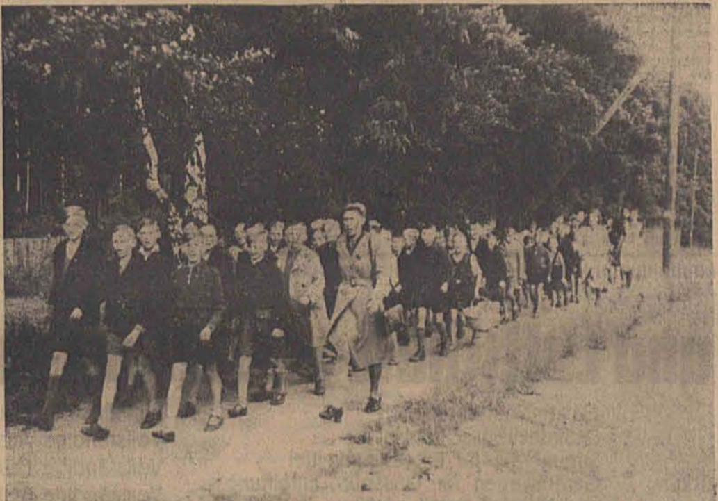
Besonders beliebt sind kleine Wanderungen durch Wälder und über Felder