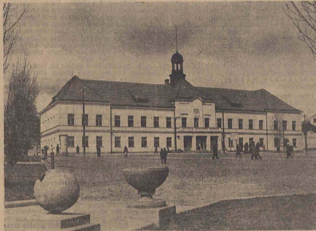
Zgierz: Das neue Rathaus

Zgierz und seine Gründung / Schon früh wanderten die Deutschen ein