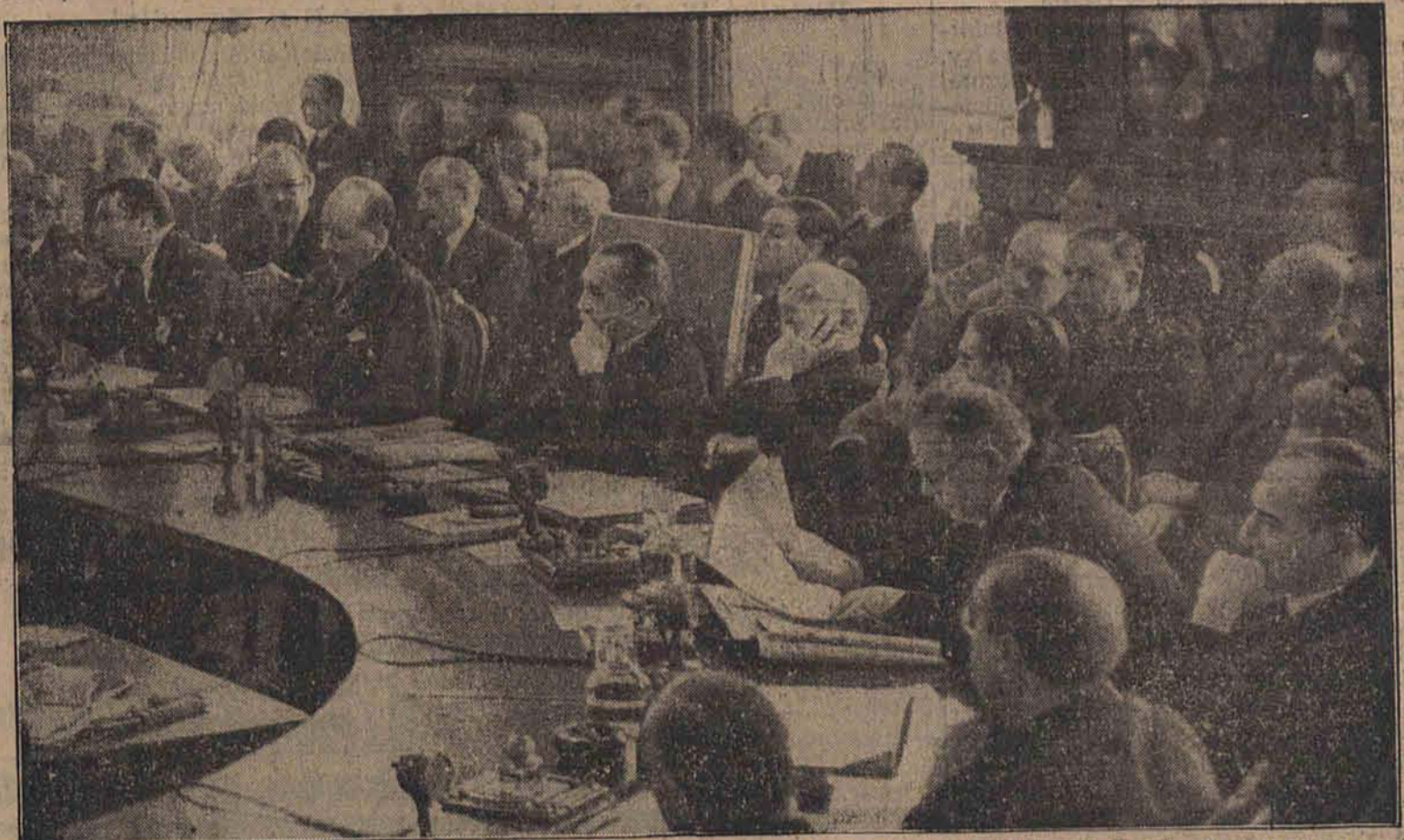
Stół podkowy w sali konferencyjnej obrad londyńskich podczas przemówienia przedstawiciela Niemiec, Ribbentropa. Na zdjęciu widoczni są (od strony lewej naprawo): Grandi (Włochy), minister spraw zagranicznych Flandin (Francja), prezydent Bruce (Australia), sekretarz generalny Avenol, angielski minister spraw zagranicznych Eden, komisarz sowiecki Litwinow i polski minister spraw zagranicznych, Józef Beck.

dzie pracować na korzyść stanowiska niemieckiego, należy się liczyć z poważnymi zastrzeżeniami ze strony rady Ligi Narodów.