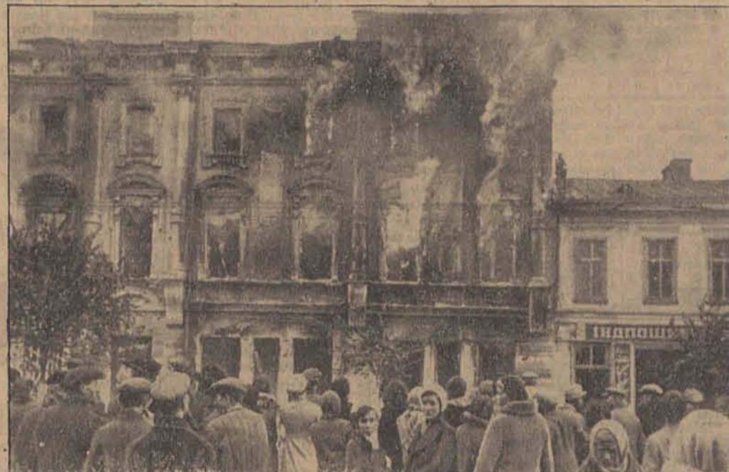
Vor ihrem Abzug versuchten die Bolschewisten, die Stadt Kiew in Brand zu stecken. Noch steht die Bevölkerung fassungslos vor den schwelenden Hausruinen