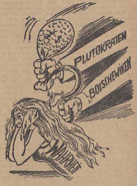
Womit sie (jeder auf seine Art) immer wieder die Wahrheit verstümmeln und niederzuhalten versuchen. (Zeichnung: Truetsch/InterpreB)

denn dieser Beruf war im bolschewistischen Staat ausgestorben, hatten die meisten Amerikanerinnen genug von diesem „Paradies“ und lehrten an Bord der „Roma“ zurück.