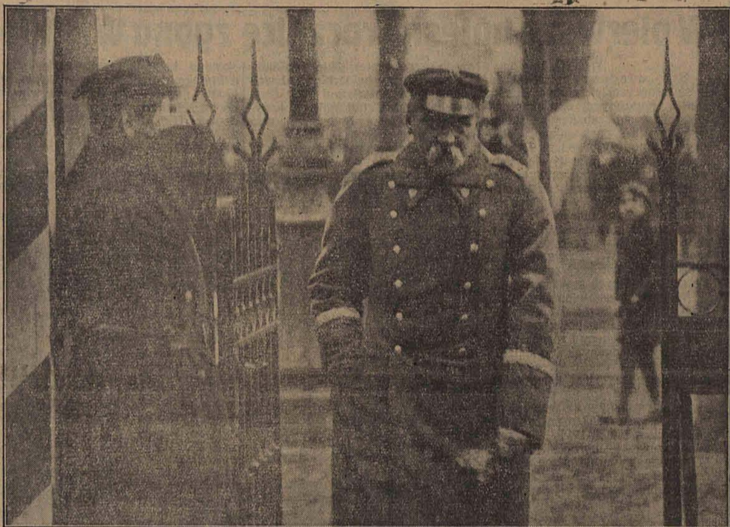
W bolesną rocznicę: Marszałek opuszcza Belweder.

(PAT) Uroczystości uczczenia pamięci Marszałka Piłsudskiego odbyły się na polach bitew pod Arras przy udziale tłumów b. wojskowych polskich i sprzymierzonych oraz francuskich i polskich władz cywilnych i wojskowych.