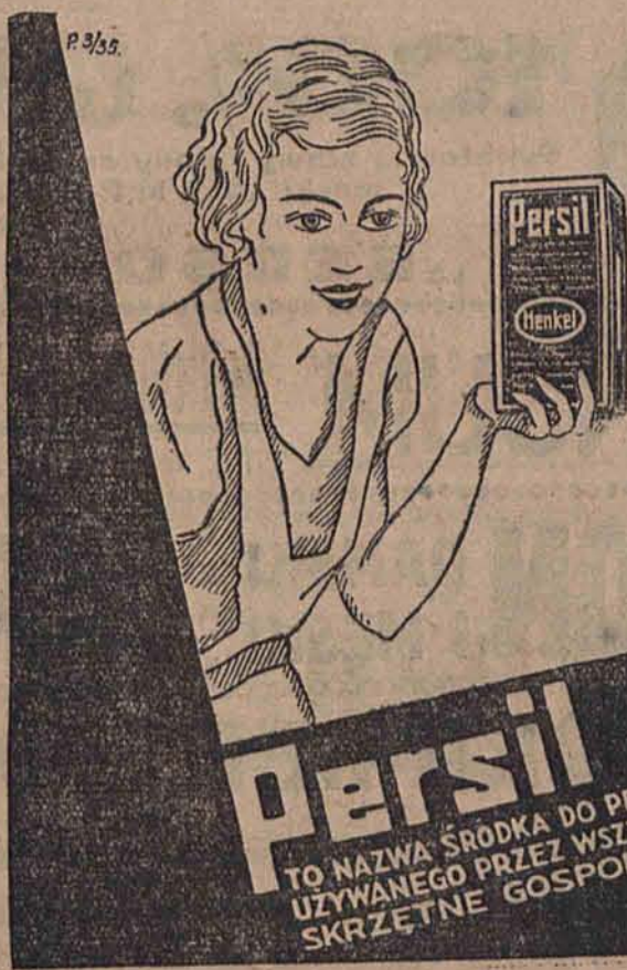
Do moczenia bielizny: HENK O. soda do prania i bielizna.