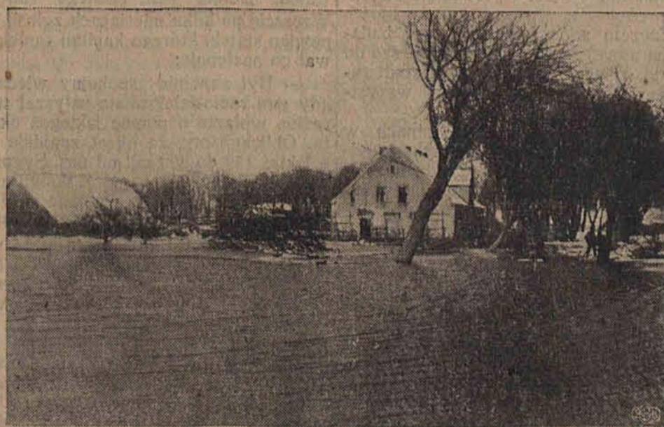
Ogólny widok zalanych przedmieść Bydgoszczy.

Warszawa, 12 marca. od wczoraj zaczęła dość gwałtownie Wista w górnym i środkowym biegu przybierać. Poziom wody podnosi się z