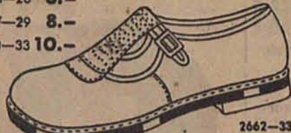
Ładny sportowy w kolorze brązowym.