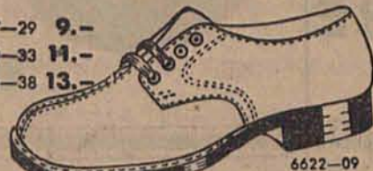
Sportowy dziecięcy półbut na skórzanej podszewie.