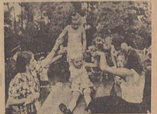
Mit großer Freude waren die Kinder am Werk

Im Auftrage des Reichssportführers veranstaltete der NS-Reichsbund für Leibesübungen, Kreis Litzmannstadt, auf dem Sportplatz im Hitler-Jugend-Park einen Turn- und Spieltag für Kinder.