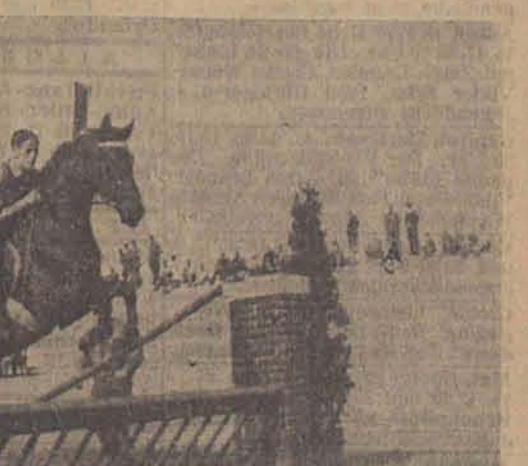
Moment aus einem Jagdspringen über ein Hindernis (Aufn. [2]: Jaskow)

Alles in allem fand die Veranstaltung allseitig einen so guten Anklang, daß man nur wünschen kann, daß sie bald — und möglichst in gesteigerter turniersportlicher Sinne — ihre Wiederholung findet und schließlich zu einer regelmäßigen in unserer pferdesportfreundlichen Stadt wird.