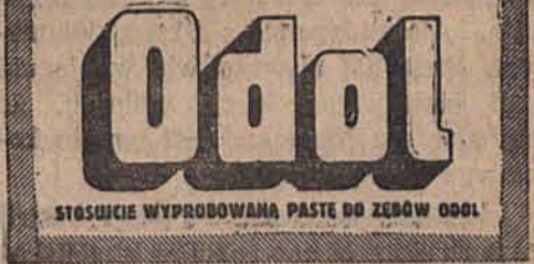
STOSUJĄCIE WYPRÓBOWANĄ PASTĘ DO ZĘBÓW ODOL

Osad na zębach bardzo sprzyja rozwijaniu się bakterii i kwassów, które z kolei niszczą emalle zębów i wywołują próchnice. Jest więc obowiązkiem każdego kulturalnego człowieka czyścić zęby kilka razy dziennie