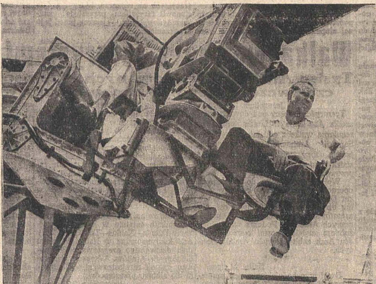
Reporterzy aktualności pracują często w warunkach akrobatycznych.

Ale właściwą działalność ujawnił w produkcji filmów krótkometrażowych. On też założył „Związek Producentów Filmów Krótkometrażowych” i był jego wielokrotnym prezesem.