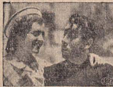
Stynny komik francuski Fernand z swą partnerką Lisette Lanvin.