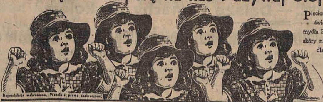
Reprodukcja wzbroszona. Wszelkie prawa zastrzeżone.

Pięcioraczki Kanadyjskie mają 4 lata. Każdy podziwia różową świeżość ich cery. Zawdzięczają one to olejki oliwkowemu mydła Palmolive. Natura nie zna lepszego środka dla upiększenia skóry niż olejek oliwkowy, użyty do wyrobu mydła Palmolive. Jak dla tych słodkich dzieci, mydło Palmolive będzie również doskonałe dla Twoich dzieci i dla Ciebie samej. Rozpocznij dziś stosowanie zabiegu piękności olejkiem oliwkowym, używając mydła Palmolive. Używaj je także do kąpieli dla utrzymania świeżości ciała.