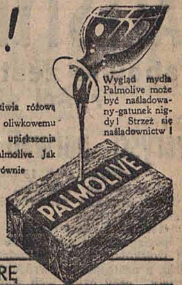
Wygląd mydła Palmolive może być naśladowany - gatunek nudy! Strzeż się naśladownictwa!

Pięcioraczki Kanadyjskie mają 4 lata. Każdy podziwia różową świeżość ich cery. Zawdzięczają one to olejki oliwkowemu mydła Palmolive. Natura nie zna lepszego środka dla upiększenia skóry niż olejek oliwkowy, użyty do wyrobu mydła Palmolive. Jak dla tych słodkich dzieci, mydło Palmolive będzie również doskonałe dla Twoich dzieci i dla Ciebie samej. Rozpocznij dziś stosowanie zabiegu piękności olejkiem oliwkowym, używając mydła Palmolive. Używaj je także do kąpieli dla utrzymania świeżości ciała.