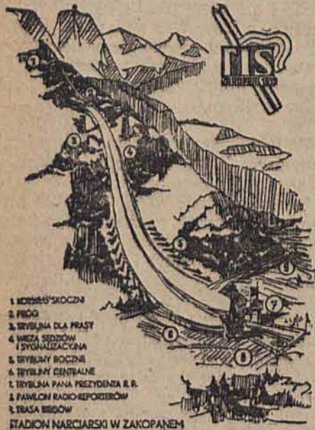
1. NOWY SKOCZNI 2. PRÓG 3. TRYBUNA DLA PRASY 4. WIEŻA SIEDZÓW 5. TRYBUNA SĄDOWA 6. TRYBUNA BOJOWA 7. TRYBUNA CENTRALNA 8. TRYBUNA PANA PREZYDENTA R. R. 9. PAVILION RADIO REPERTOREM 10. TRASA BIEGÓW STADION NARCIARSKI W ZAKOPANEM

Przygotowania do mistrzostw F.I.S. — Budowa kolejek, schronisk i garażów