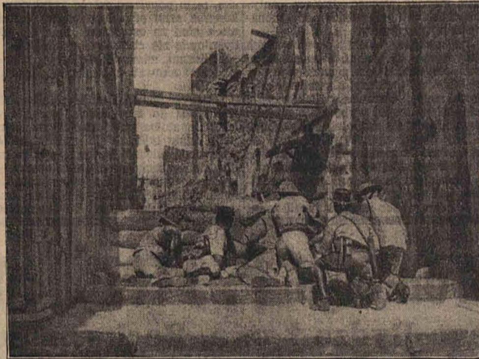
Na zdjęciu widzimy żołnierzy angielskich za barykadami na ulicach Jeruzolimy.

Faktem jest, że najwięcej oliar ponieśli Żydzi. Broniąc się możliwie najenergiczniej przed atakami arabskimi, Żydzi nie uciekali się do aktów odwetu. Nie było ani jednego wypadku napadu żydowskiego na wieś arabską, mimo niezliczonych napaści na osady żydowskie. Żydzi nie uważają Arabów za swych nieprzyjaciół, chyba że chodzi o terory-