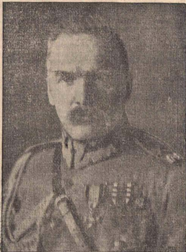
Marszałek Józef Piłsudski