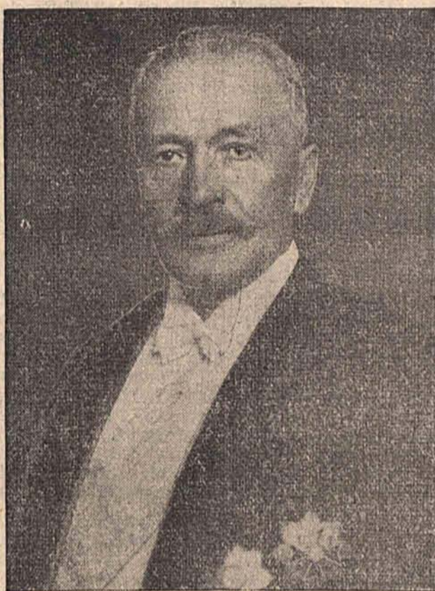
Prezydent Ignacy Mościcki