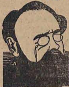
Z o l a

Film amerykański „Zycie Emila Zoli” z doskonałym aktorem Pauliem Munim, wyspecjalizowanym w rolach europejskich sław (Pasteur, Zola, a może niedługo